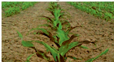
YaraVita™ Kukurydza 5l/ha